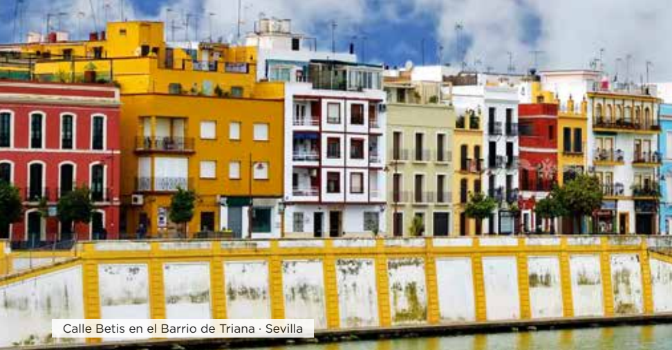
Calle Betis en el Barrio de Triana · Sevilla