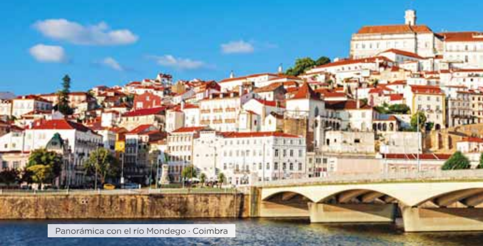
Panorámica con el río Mondego · Coimbra