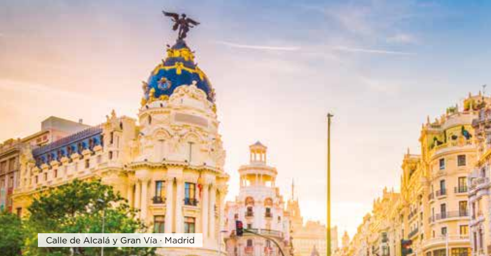
Calle de Alcalá y Gran Vía · Madrid